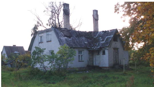
Elamu Nõlva tn 7

Pärast vastavasisulist ettekannet ja mõningast arutelu otsustas volikogu müüa vallale kuuluvad korterimandid Kaupluse tn 3 nr 7 ja nr 8; Nõlva tn 18 nr 1 ja nr 2; Nõlva tn 7 nr 2, nr 3, nr 4, nr 5, nr 6, nr 7.