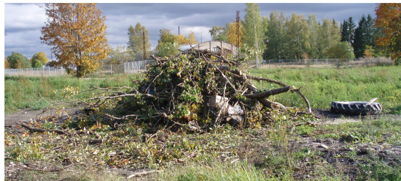
Okste põletamisplats asub Tupiku mäe ja tehaste vahelisel alal

Tupiku prügimägi on juba aastaid suletud. Nüüdseks on see ala korastatud. Kahjuks on aga meie vallas inimesi, kes ei hooli kenast ja puhtast ümbrusest ja toovad oma prahi ikka veel endise Tupiku prügimäe alale.