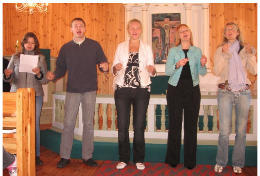
Tänavusel koolirahu kontserdil Järvakandi Pauluse kirikus astus üles EKNK gospelansambel.