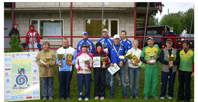
Jãrvakandi Open 2007 võitjad

Teine traditsioon on kutsuda võistluste lõpetamisel sammu võrra rivi ette kõik need, kes tegid võistlustel hooaja rekordi. Teise sammu võivad astuda need, kes tegid ka isikliku rekordi, edasi need, kes tegid väljaku või koguni riigi rekordi. Paljud võistlejad kiidavad meie kommet – hea idee tunnustada ka neid, kes tublisti esinesid, kuid sellega esikolmikusse ei pääsenud. Auahnemates tekitab see motivatsiooni, kui nad kõiki samme ette astuda ei saa.