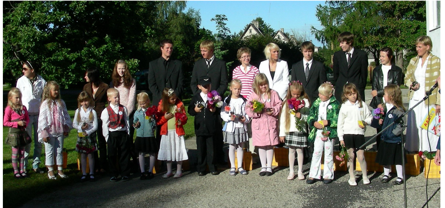
Esimene klass abiturientidega kooliaasta avaaktusel.

1. septembril võis meie kool tõdeda, et uueks õppeaastaks oleme valmis. Korras on koolihooned: vana kooliosa sai uue katuse, kogu koolikompleks automaatse tuleohust teavitamissüsteemi (ATS), eelnevalt oli taastatud võimla ventilatsioonisüsteem ja tööõpetusmaja saanud tänapäevased töövahendid. Kui rääkida ka tulevikust, siis uue KOIT-projekti avanemisel taotleme spordikompleksi täielikku uuendamist. Põhiliselt omavahenditest tuleb 2008. aastal renoveerida vana kooliosa elektrisüsteem ja veel sellel aastal garaažihoone.