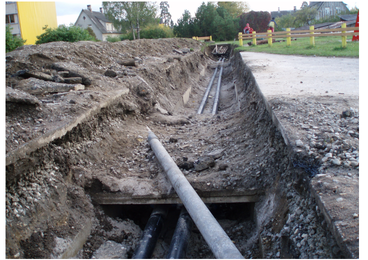
Ka soojatrasid remonti nõuab lisakulutusi

vakandiga võrreldavas Kohilas (maagaas) on kinnitatud soojusenergia piirhinnaks 845.00 kr/MWh ja soojuse lõpphinnaks kujuneb neile koos käibemaksuga 997.00 kr/MWh (meil 905.06 kr/MWh).