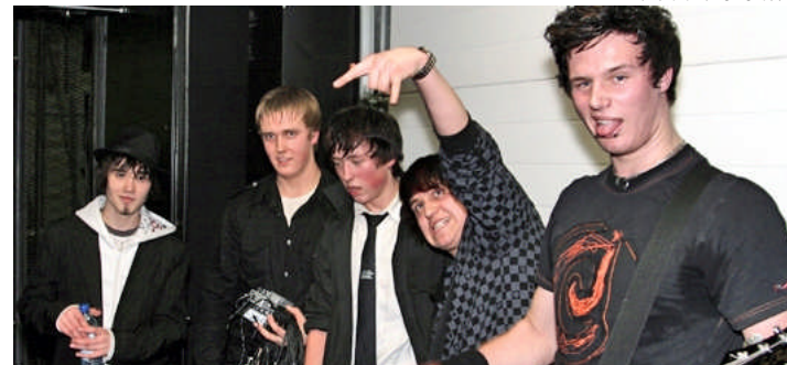
Sick of Sorrow