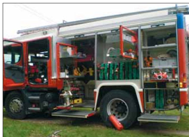
Huvilised võisid uudistada ka päästetehnikat.