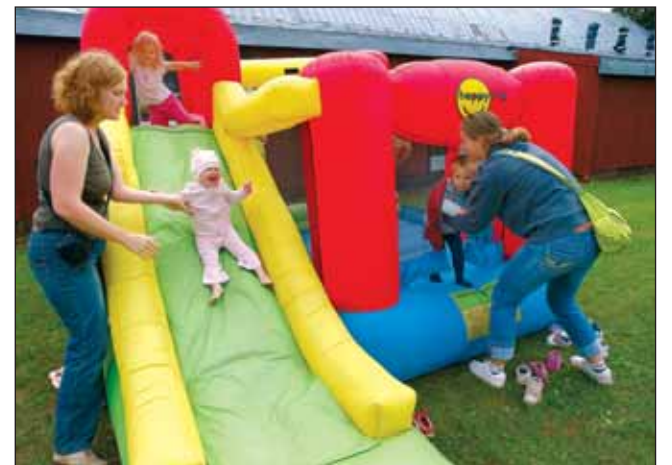
Lastel oli batuudil lõbu laialt.