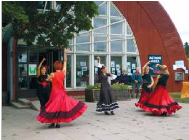
Flamenkotantsijad rahvamaja ees.