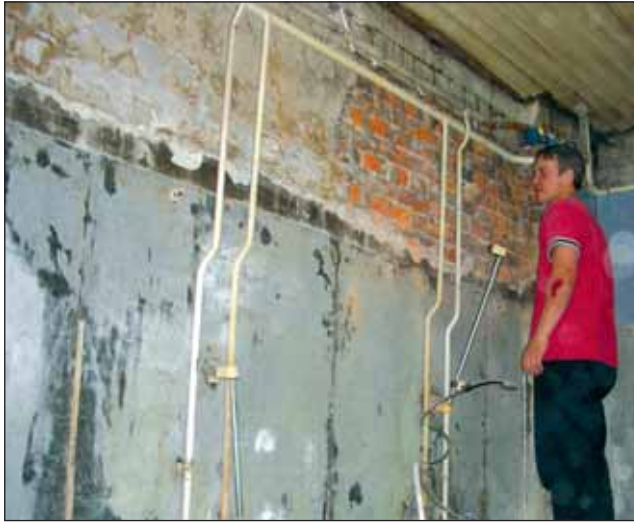
Meestesauna pesemisruum remonditööde alguses ...