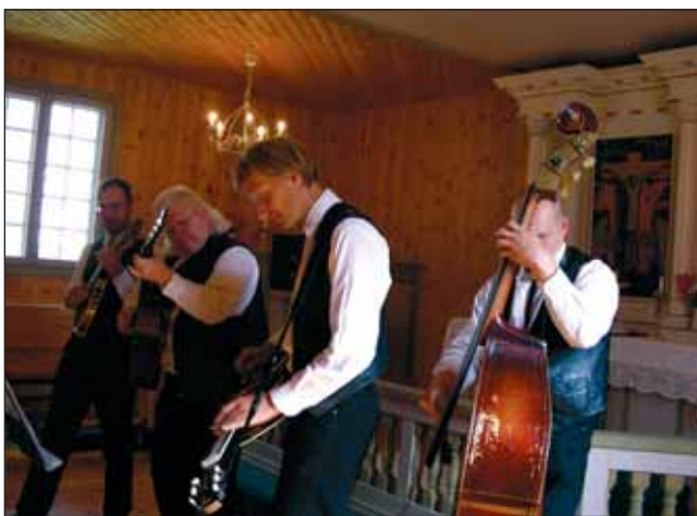
Vallapäevad lõppesid ansambli Robirohi kirikukontserdiga.