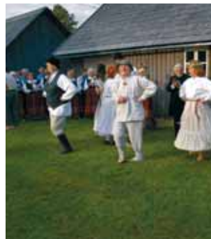
Näidendis lõi kaasa ka rahvatantsurühm.