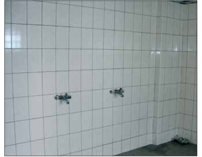
... ja lõpufaasis.