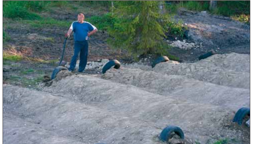
Krossirada rajati suuresti vabatahtlike talguliste nõul ja jõul.