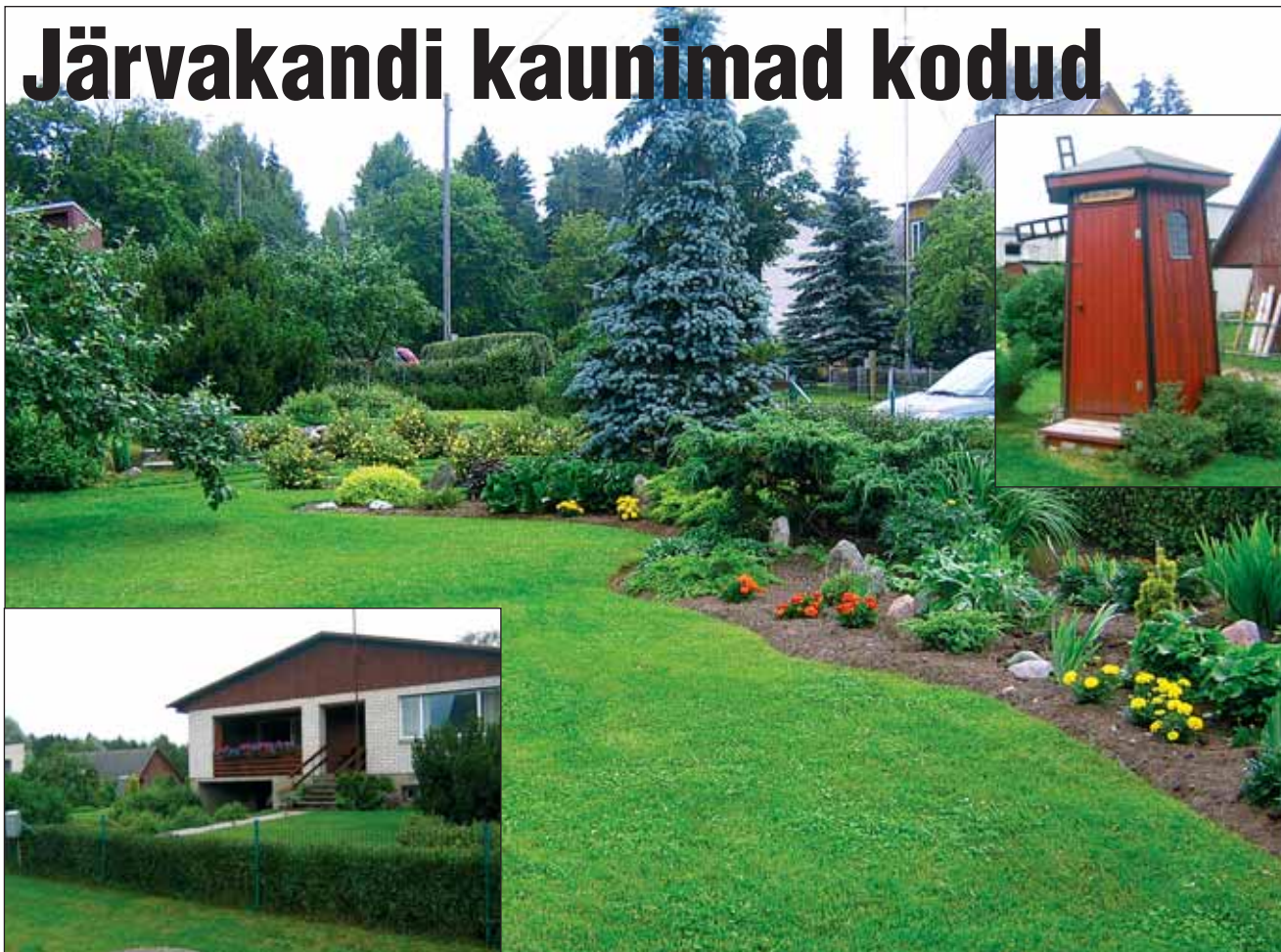
Perekond Rajasaare kodu.