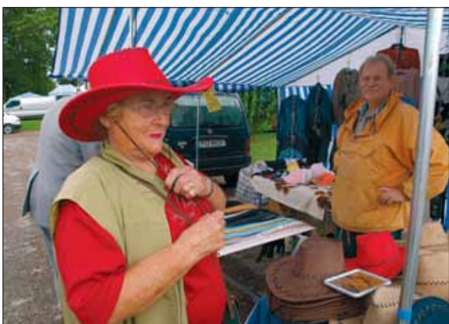
Kuigi müügilettide ees ei olnud just trügimist, jätkus ostjaid ometi.