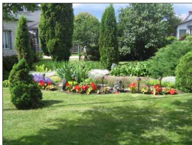
Perekond Riipulkade koduõu