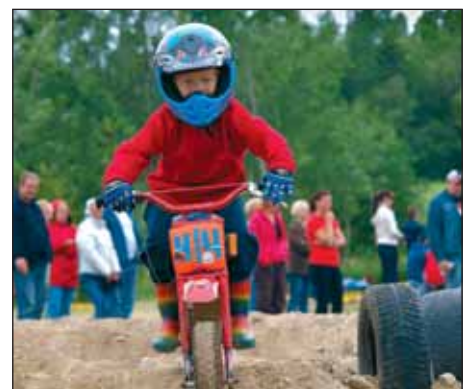
Krossirajal võistlesid ka verinoored tsiklismehed.