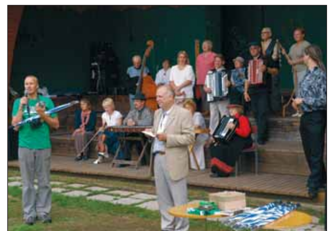
Puupäevade lõpetamisel ja vallapäevade avamisel astus üles Raplamaa rahvapilliorkester (tagaplaanil).