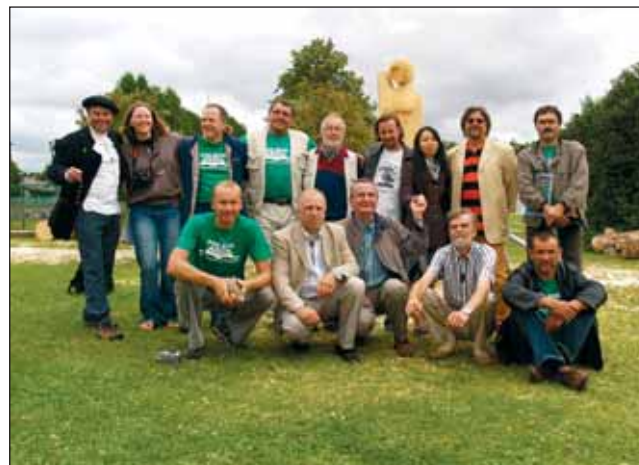
Skulptorid koos vallavanemaga puupäevade lõpetamisel.