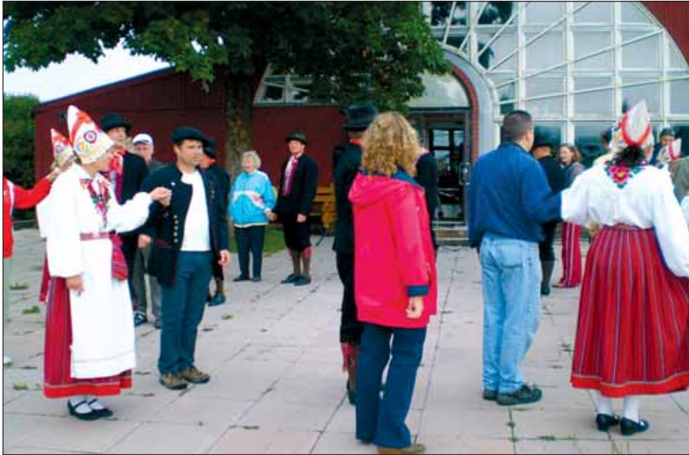
Puupäevade avamisel esinenud Alu segarahvatantsurühm haaras tantsuringi ka publiku.