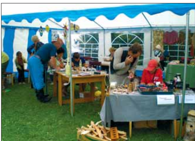
Töötubades jätkus tegevust kogu päevaks.