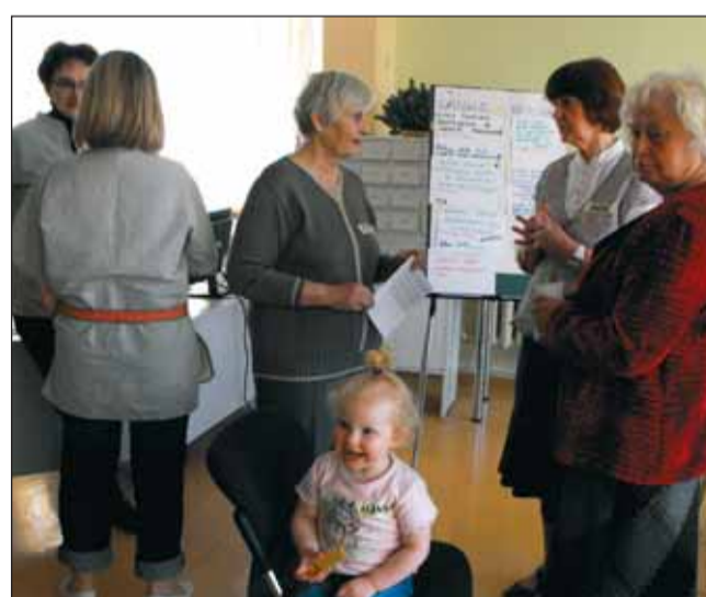
Talgulised Eestit paremaks tegemas.

Kindlasti on hoolivaid inimesi Järvakandis rohkem,