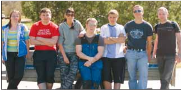
Osa mänguväljakut korrastanud seltskonnast.