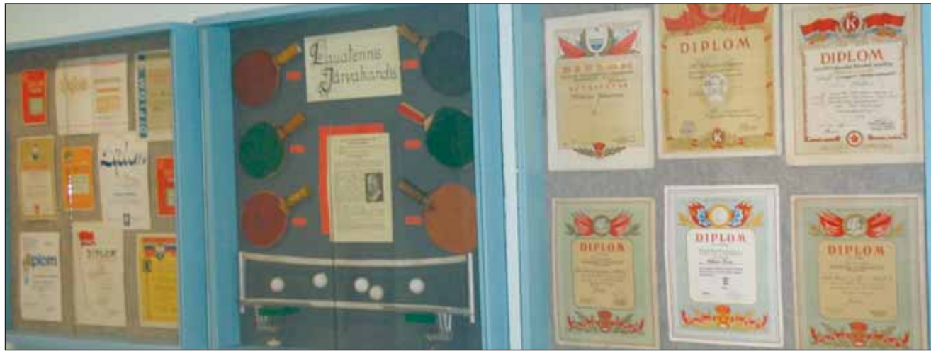
Stend Järvakandi lauatennise ajaloost.