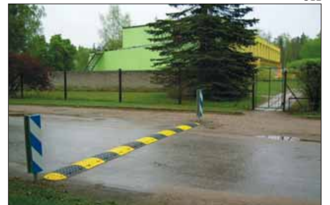
Lasteaia läheduses kiirust piirav künnis.