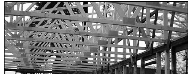
... ja uus katusekonstruktsioon.