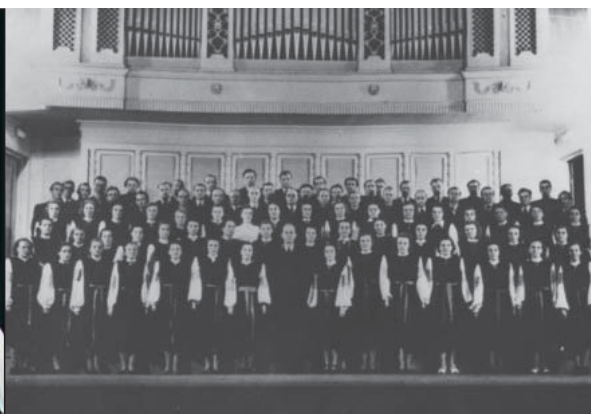
Segakoor aastal 2009 Järvakandi Kultuurihallis ...