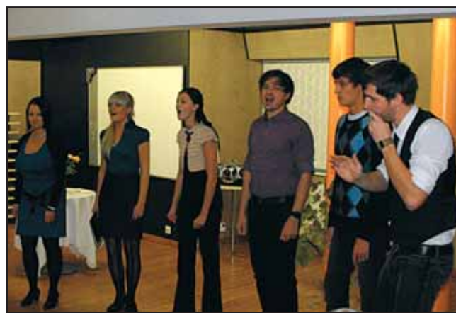
JK Vokaalansambel Chilling.