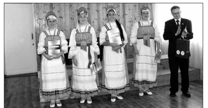
Zarni Voitjas Järvakandi Gümnaasiumis.