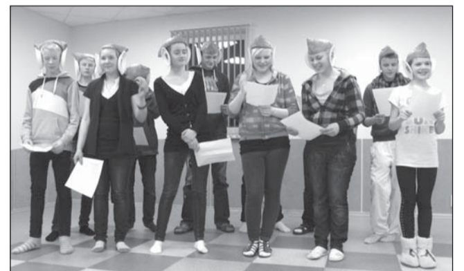
Smurffide ansambel „Kungla rahvast“ esitamas.