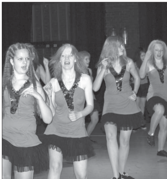
Järvakandi TantsuStudio tantsijad Koolitantsul.