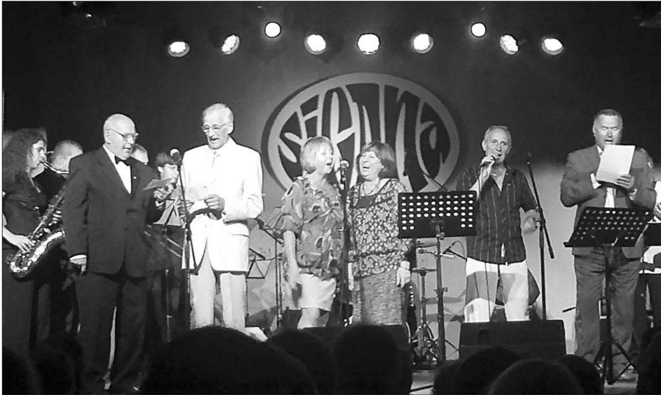
Armastatud SiCaNa solistid taas laval.

Laval olid andsid endast parima – see oli kui aastakümnete eest: muusika tuli südamest, puudutades mälestusi ja hingekeeli, kõik oli nii, kui peab. Ovatsioonid saalis olid vahetud ja „laes“. Publiku silme all rullus lahti tükike kaunist möödunust, ühest ajajärgust SiCaNa tegemistes.