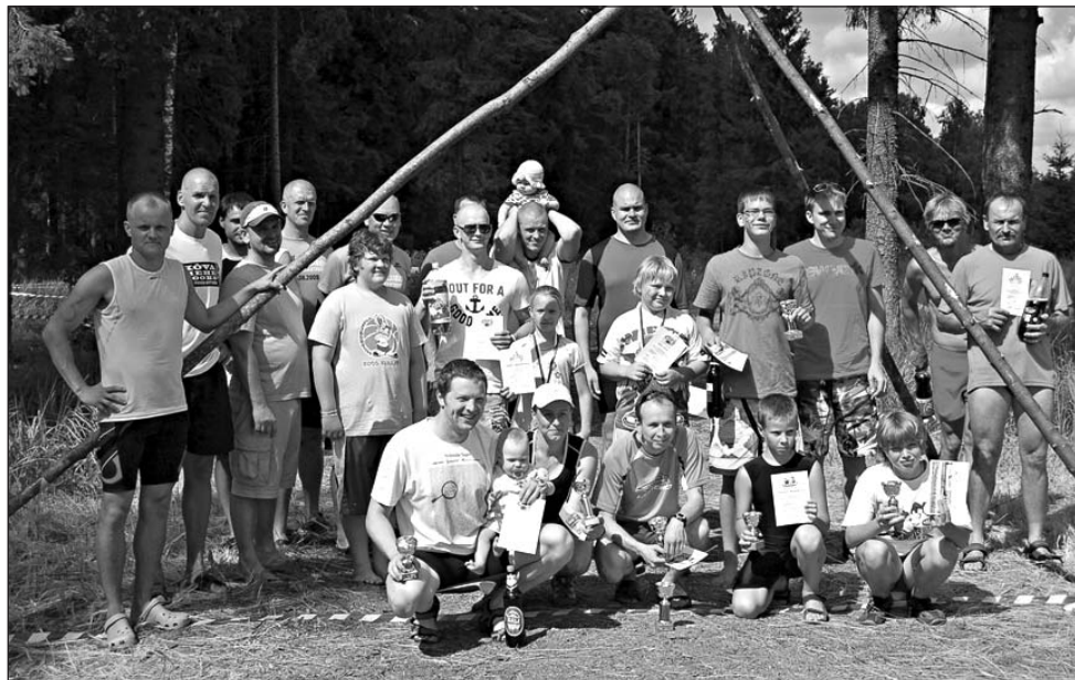
Raudmees 2011 osalejad.