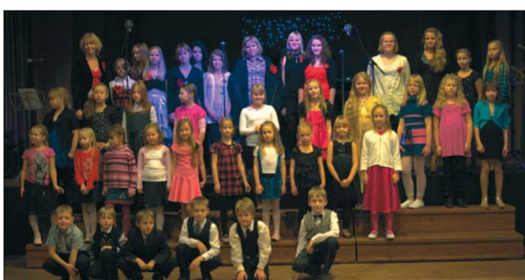
Esinejad kooli jõulukontserdilt.