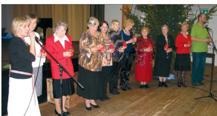
Austati kultuurihalli elus olulisi inimesi.