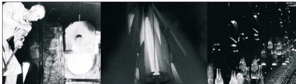
2010. aastal pidas Järvakandi Klaasimuseum oma 130. sünnipäeva.

Dekaadi lõpuks jõudsim ehitamise kõrvalt juba sedavõrd koguda, et võimalikuks sai Järvakandi tutvustava näituse loomine (dets 2009). Kogu praegugi avatud Järvakandi juubelinäitusel väljapandud klaas on välja otsitud, siis palutud, lunitud, aga ka ostetud. Viimasele aitasid kõvasti kaasa vahepealsed 2,5 aastat (2006–2008), kus vallal oli võimalus kogude loomiseks väärikalt panustada. Selleks aastaks eraldatud summa on nii valla eelarve mõistes kui ka teenitud piletitulu suhtes kaduvväike. Kui korrutada see kümnega ja võrrelda saadud kümneaastase kogumisperioodiga, siis selle ajaga kaob vanu esemeid prügiks rohkem, kui me nende vahenditega päästa suudame. See ei ole tarbimiskulu nagu lastetoa mänguasjad, vaid akumuleeruv väärtus. Esimesed rändavad varsti prügikasti ja asemele nõutakse uusi. Aga vanasti olid lapsel vaid mõned mänguasjad, mida ta ka väga kalliks pidas. Hoidmine ja hoitud olemine ongi siinjuures kõige tähtsam. Hingega olemine. Ja seda mitte ainult inimeste, vaid ka asjade suhtes. Muuseumis