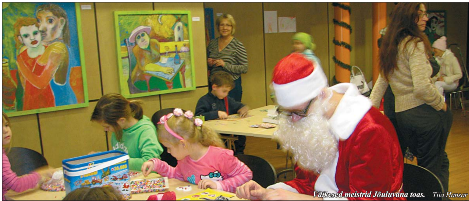
Väikesed meistrid Jõuluvana toas. Tiia Hansar