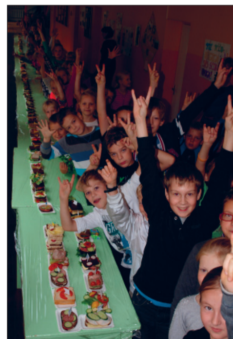
Pikk võileib ja rõõmsad õpilased