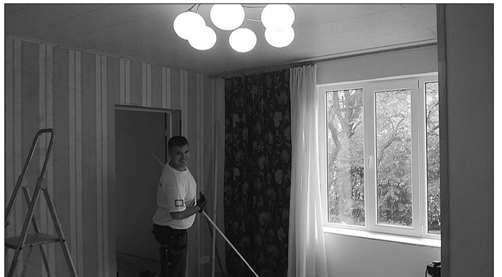
Renoveerimistööd algus- ja lõppfaasis