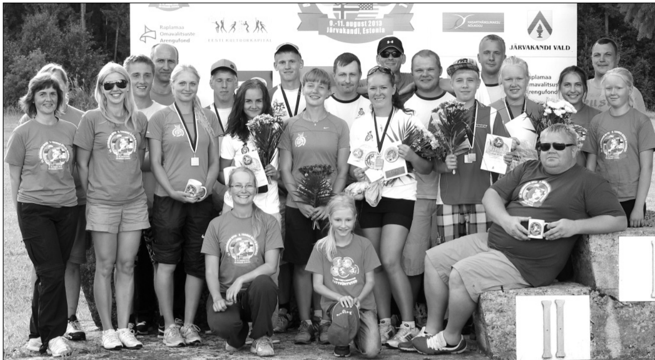
Järvakandi Open korraldajad