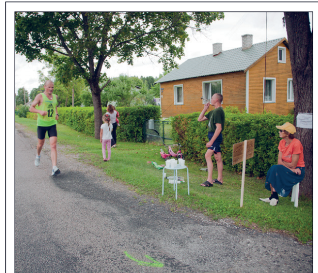
Täname kõiki JÄRVKANDI ELANIKKE, kes aitasid II IGAMEHE MARATONIST teha TÕELISE rahvapeo.