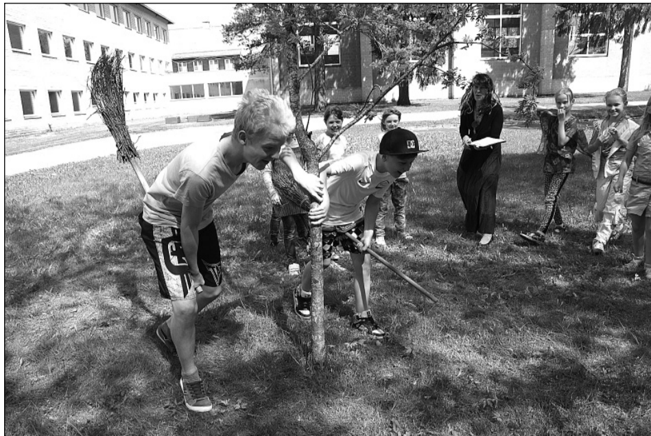
Tüdrukutenädala luuakrossis osalesid ka meesnõiad

14. märtsil, emakeelepäeval olid kõige agaramad algklasside mudilased, kes