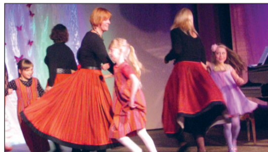
Emade ja laste ühine tants