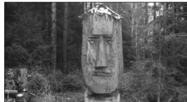
Üks terviserajaja puukujudest