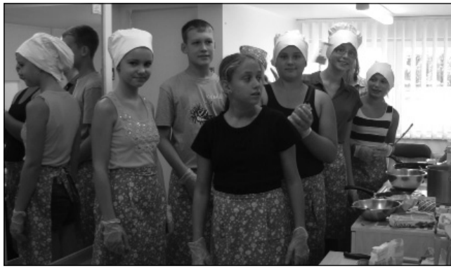
Rahvuslike toitude töötuba perepäeval

Nagu näete, küsimused ei lõpegi... Ja veel üks: mida olen õppinud, töötades kuuendat aastat kultuurivaldkonnas? Sellele julgen vastata nii: iga inimene on tähtis ja väärtuslik; tööd ei tohi ületähtsustada, vaid on vaja leida/