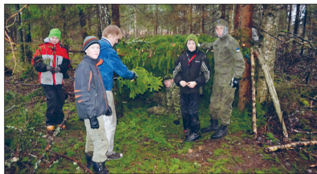
Soovi korral võis õõbida ka okstest onnis