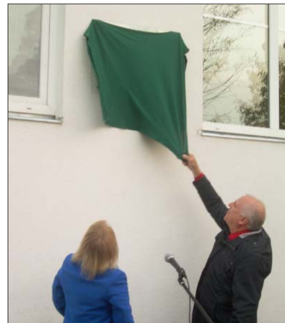
Direktor ja vallavanem nimetahvli katet eemaldamas