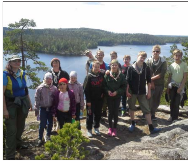
Külas Juva skautidel

Juuni keskpaigas toimus Rapla maakonna riskilaste projekti raames kahepäevane suvelaager Karitsa jahibaasis. Laagri jooksul omandati palju uusi teadmisi erinevates valdkondades ja noortekeskuste ühislaagreid on plaanis edaspidigi korraldada. Projekt "Riskilaste toetusprogrammi rakendamise läbi noortekeskuste" on rahastatud Euroopa Majanduspiirkonna (EMP) toetuste programmi „Riskilapsed ja –noored“ taotlusvoorst „Noorte- ja noorsoo-