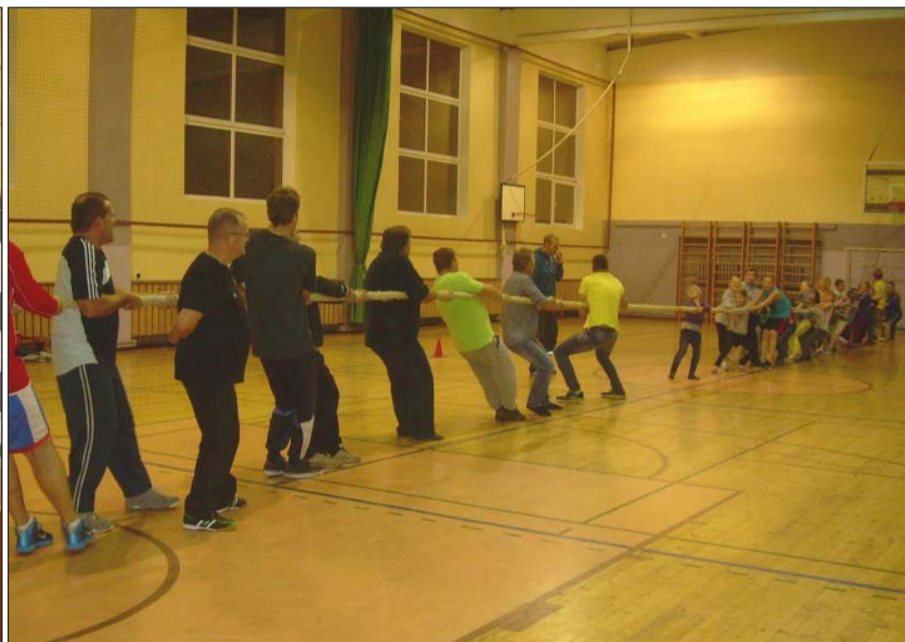
Isadega rammu katsumas