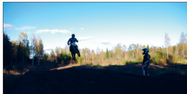
Uus rada võimaldab sooritada pikki