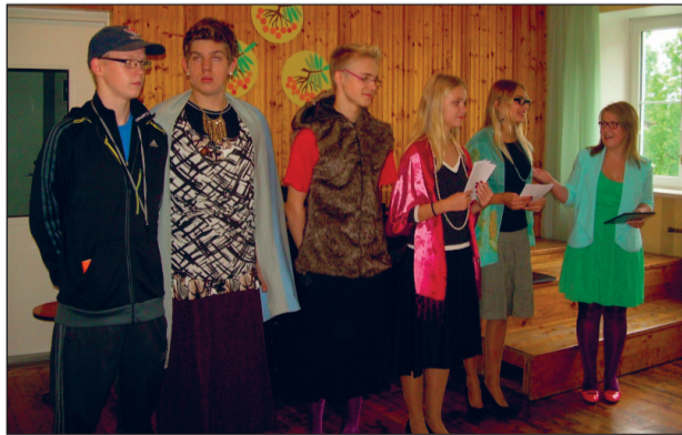
„Õpetajad“ päeva avaaktusel