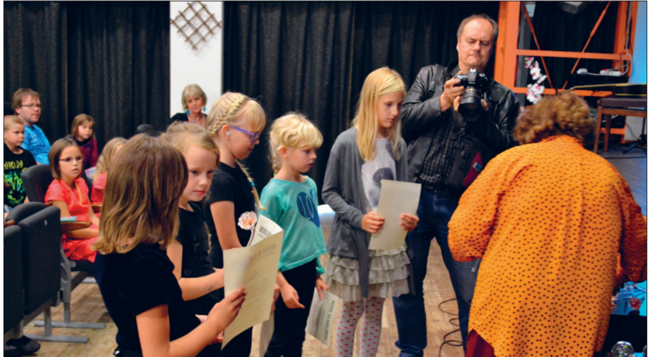
Osa žürii kõrgeima tunnustuse pälvinud taiese „Klaasipealinn“ autoritegrupist.

Väljaandja Järvakandi Vallavalitsus Järvakandi, Tallinna mnt 17 Toimetaja Jaanus Randla; tel 489 4710 e-post: kaja@jarvakandi.ee Trükk: Kuma trükikoda