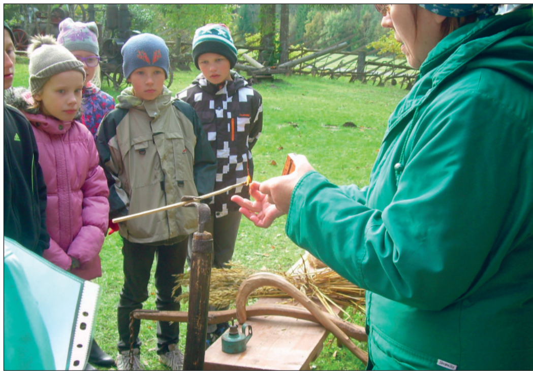
„Tule tulemine“ Sillaotsal