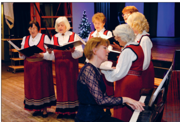
Lauluterivitus koguduse naisansambli