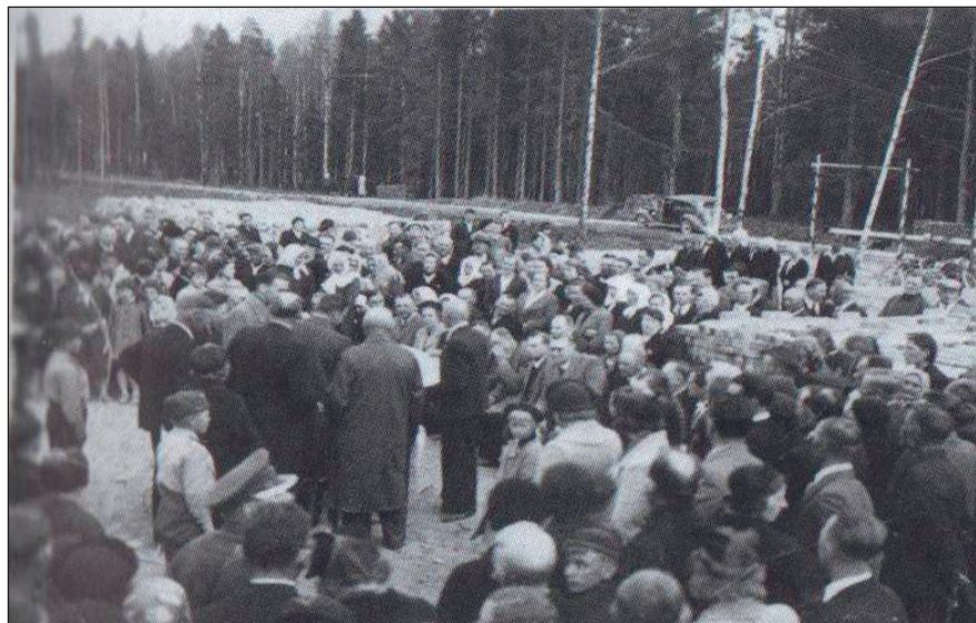
Nurgakivi panemine 14. mail 1938