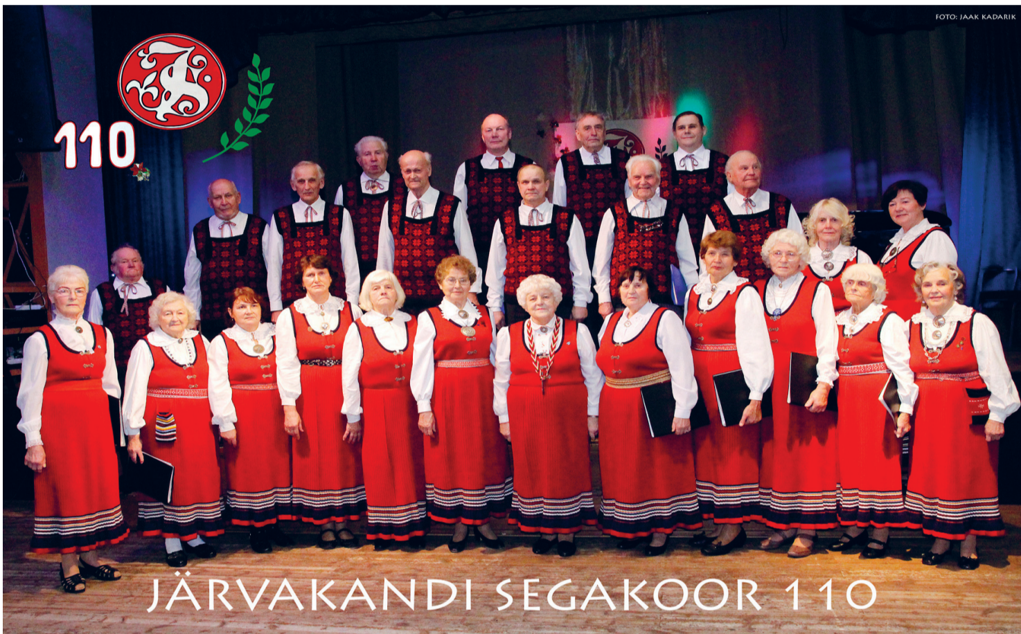
JÄRVAKANDI SEGAKOOR 110

6. detsembril tähistas meie segakoor 110. tegevusaasta täitumist.