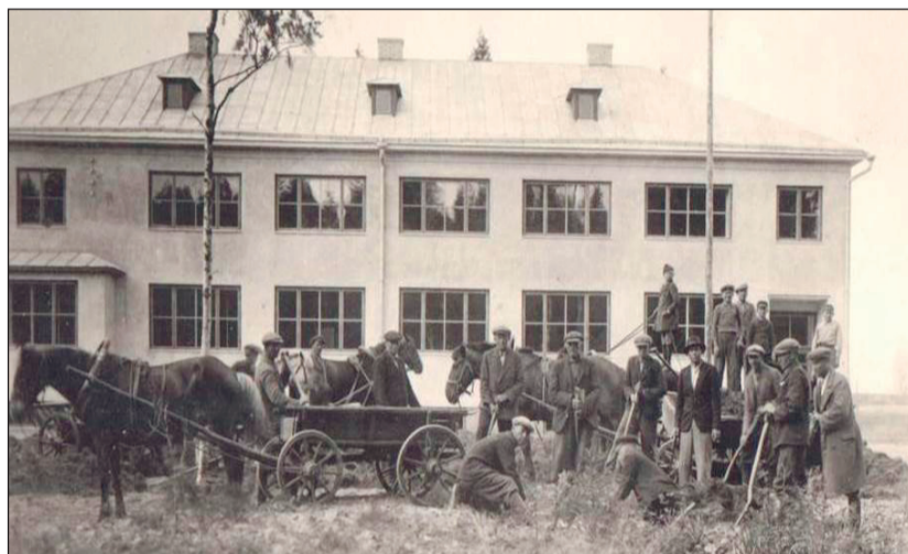
Mullavedamistalgud (haljasala rajamine) 1. juunil 1940