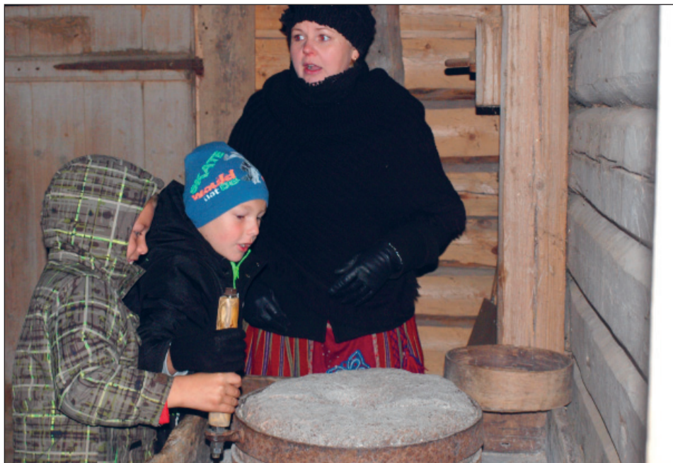
Käsikiviga vilja jahvatamas