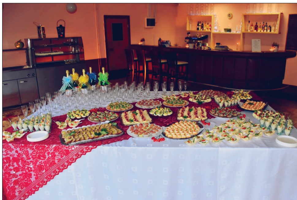
Külastajatele kaetud rikkalik suupistelaud

Teistest tegevussuundadest ja tulevikuplaanidest