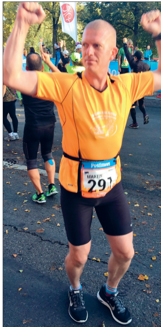
Martin Tartu linnamaratoni stardi eel