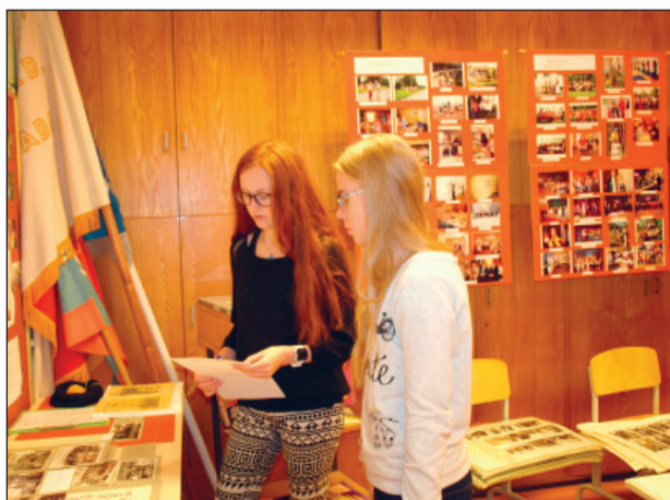
Ajalootoas „peidetud“ teadmisi otsimas