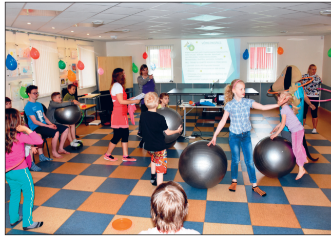
Lahtiste uste päeval

Korraldasime kaks tutvustavat praktilist koolitust, et noored oskaksid võimle-