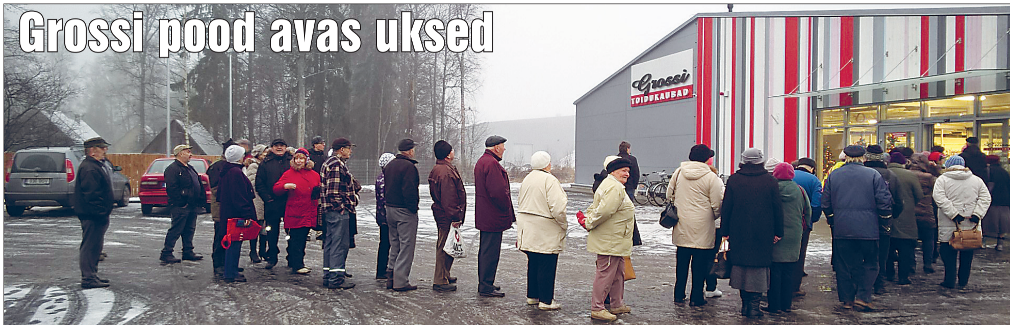
Korvijärjekord kaupluse avamishommikul