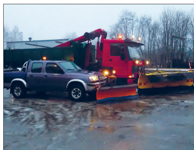
OÜ Kommunaal soetas lumetõrjetöödeks maasturi.