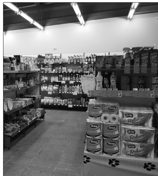
Uues kaupluseosas pakutakse majapidamistarbeid