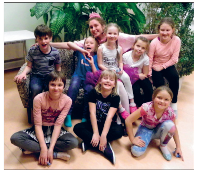
Lugemishuvilised koos printsessiga