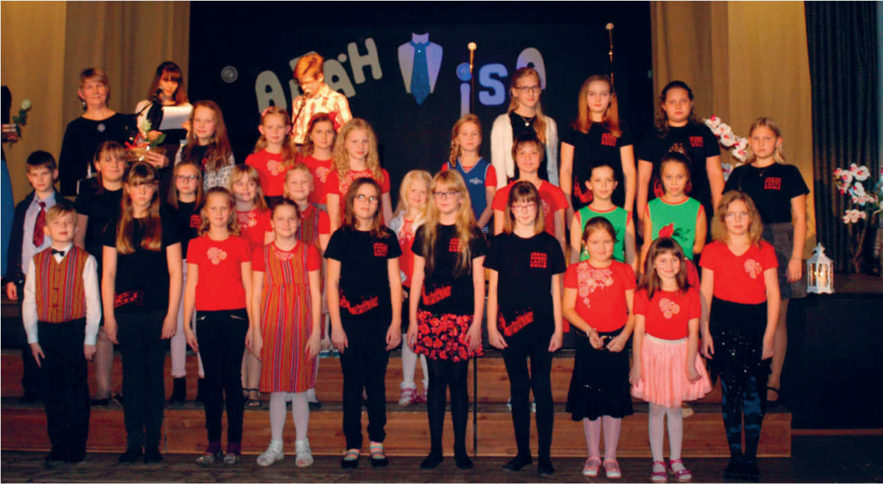
Meie laululapsed, noored kandlemängijad ja näitlejad pärast kontserti