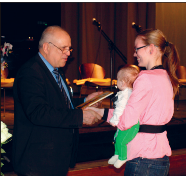
Vallavanem uut vallakodanikku õnnitlemas